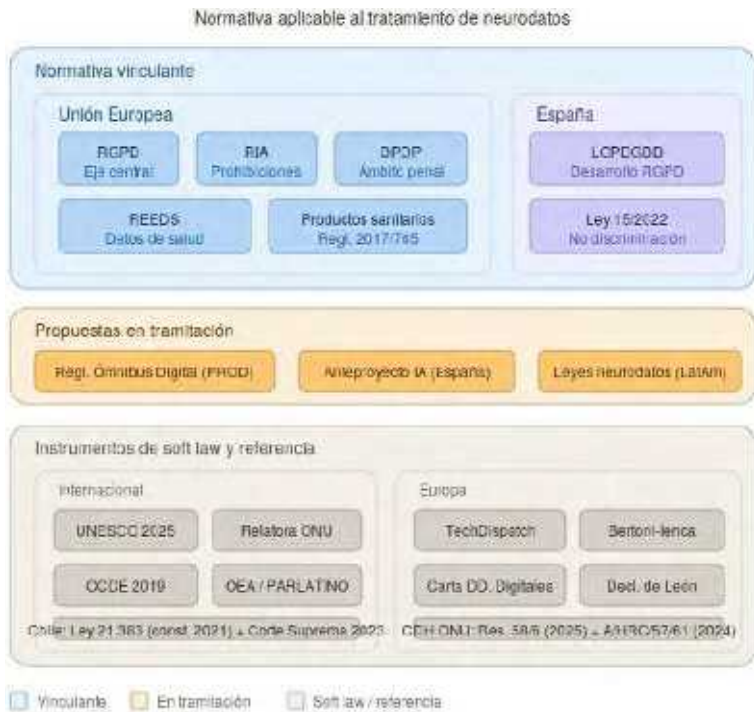
Diagrama 3 Normativa aplicable al tratamiento de neurodatos.