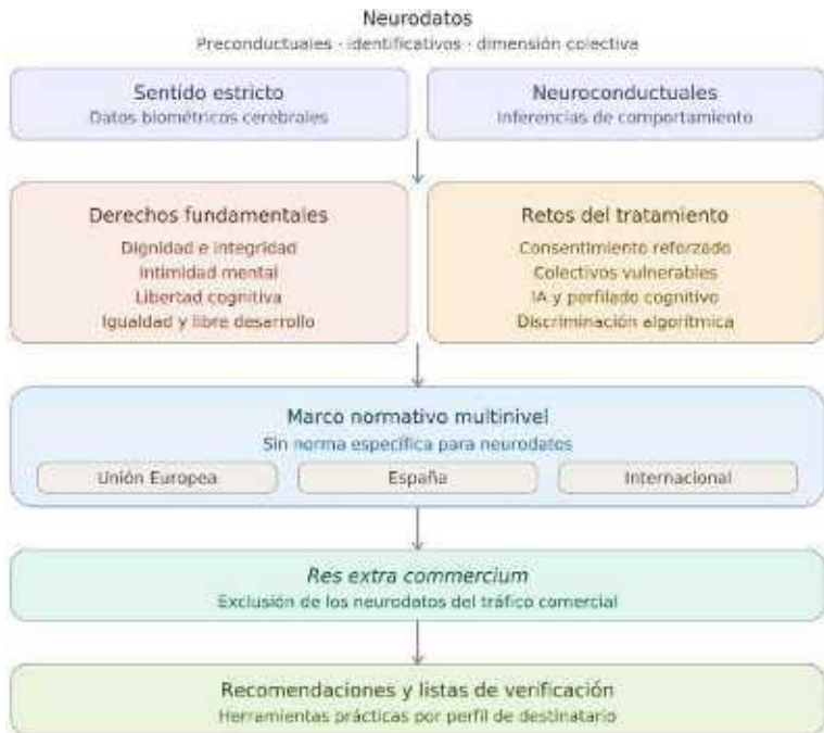
Diagrama 1 Resumen ejecutivo.

La Guía concluye con recomendaciones operativas diferenciadas por perfil de destinatario y con listas de verificación que permiten a cada operador jurídico comprobar el cumplimiento de las principales obligaciones derivadas del análisis. Estas herramientas pretenden que el documento funcione no solo como referencia doctrinal, sino como instrumento de trabajo para la práctica profesional.